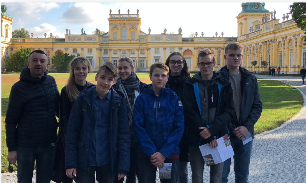
1-2.10.2018 - nasza młodzież w Warszawie.