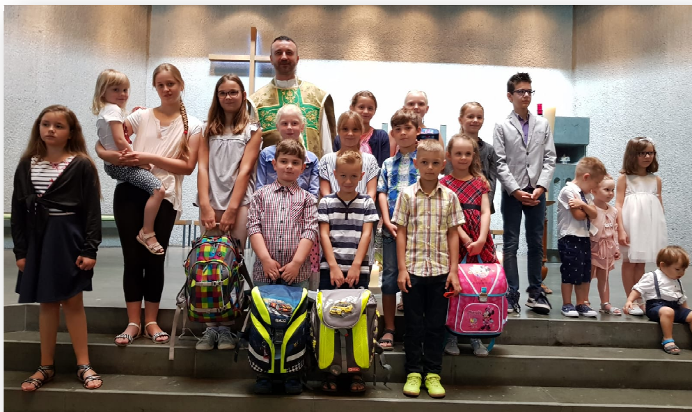
12.08.2018 - błogosławieństwo dzieci, tornistów i przyborów szkolnych, na zakończenie niedzielnej Mszy św., w Koblenz.