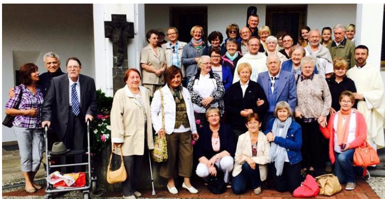
Wyjazd Senio- rów do Maria- Martent- tal