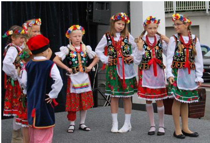
Występ dzieci na imprezie charytatywnej fundacji "Kinderseele"