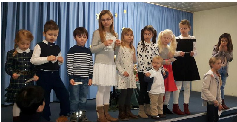
10.01.2016, spotkanie opłatkowe