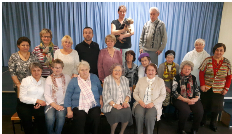
13.01.2016, spotkanie noworoczne dla seniorów