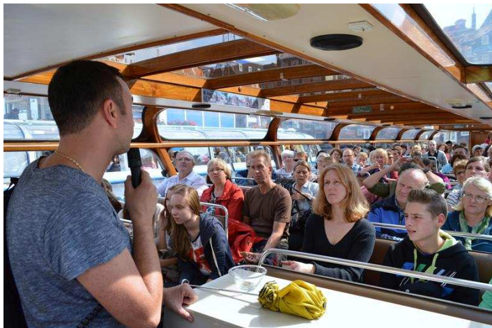
Pielgrzymko- wycieczka do Amsterdamu (13.09)