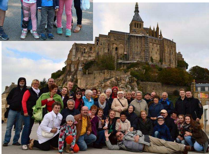
Francja - opactwo benedyk- tyńskie Mont- St-Michel (20.-23.10)