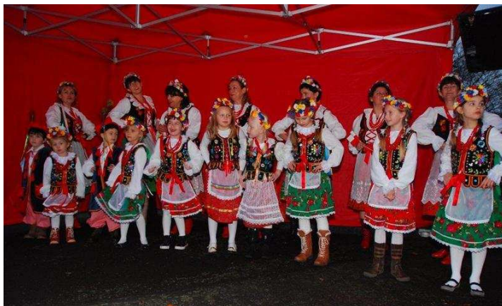
Festyn dzielnicy Lützel (15.11)