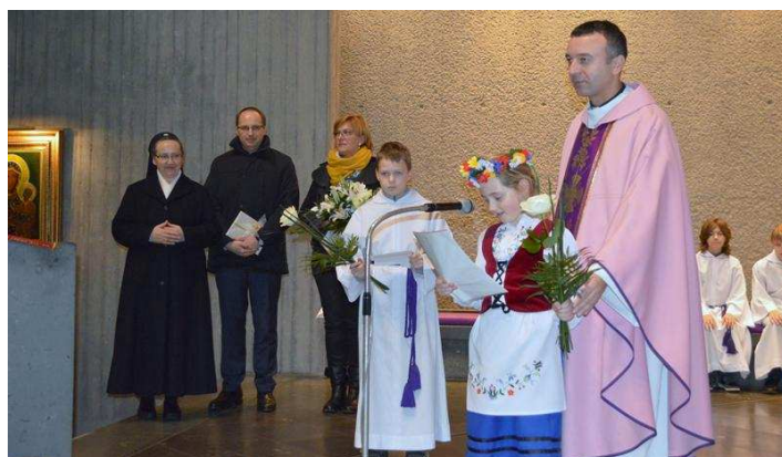
Pożegnanie Siostry Damiany (14.12)