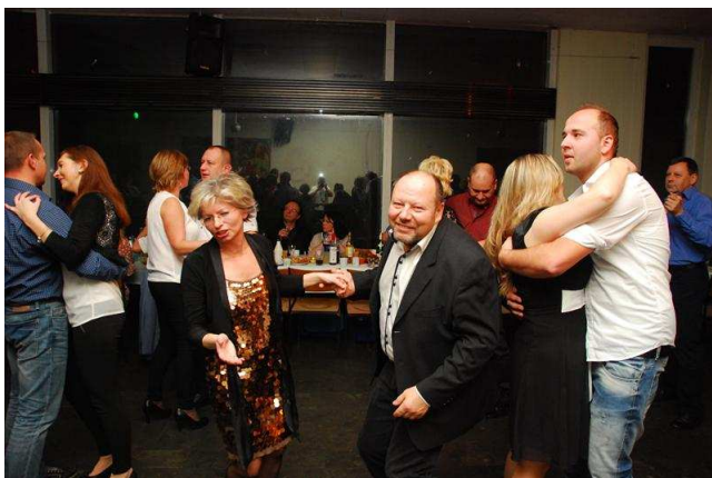
Zabawa Andrzejkowa (22.11)